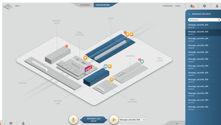
Visualisation du site en 3D

Il a pour vocation de gérer vos sources audios, de diffuser des messages dans une ou plusieurs zone(s) et de configurer l'ensemble des actions que vous souhaitez mettre en place sur votre site. PA Manager E vous permet également de planifier vos diffusions : planification des médias, gestion du volume de diffusion.